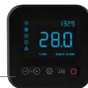
LED zaslon na dodir